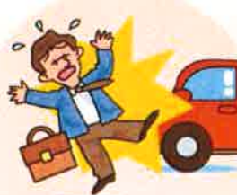
● 通勤途中の交通事故

このリーフレットは、2013年10月1日以降に保険期間が開始するご契約を対象にしています。